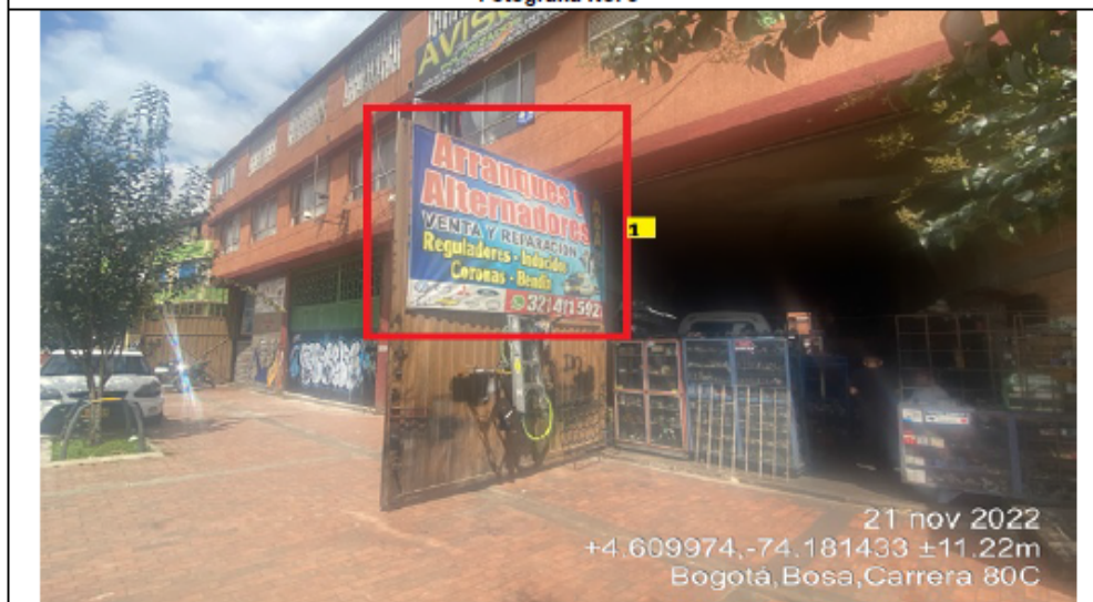
Fotografía No. 3

En la cual se evidencia un (1) elemento tipo aviso en fachada perteneciente al establecimiento comercial denominado ARRANQUES Y ALTERNADORES , el cual se encuentra ubicado en la puerta costado derecho del establecimiento, y es adicional al único elemento permitido por fachada de establecimiento comercial.